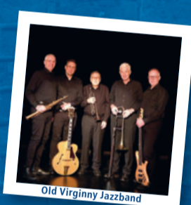
Old Virginny Jazzband